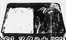
冷やしスタミナ 950円