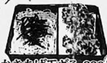
かきあげ天ざる 880円