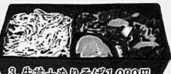
3. 牛丼+もりそば 1,080円 又はうどん