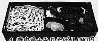
4. 焼肉重+もりそば 1,080円 又はうどん