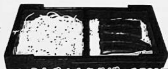
1. うな重+もりそば 1,780円 又はうどん 上 2,080円