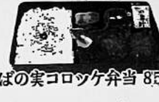
そばの実コロッケ弁当 850円