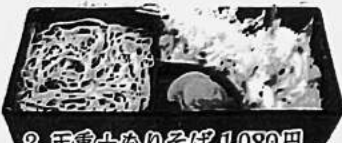
2. 天重+もりそば 1,080円 又はうどん