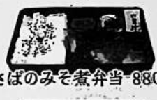
さばのみそ煮弁当 880円