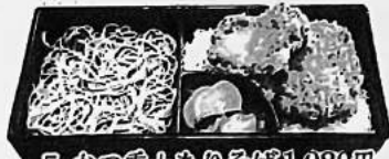
5. かつ重+もりそば 1,080円 又はうどん